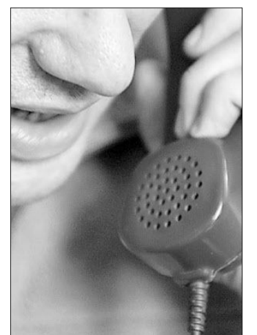
Bei der Telefonseelsorge stehen Menschen für ein Gespräch zur Verfügung. wib

Die kostenlose Grüne Nummer der Telefonseelsorge 840 000 481 ist ohne Vorwahl aus ganz Südtirol rund um die Uhr erreichbar.