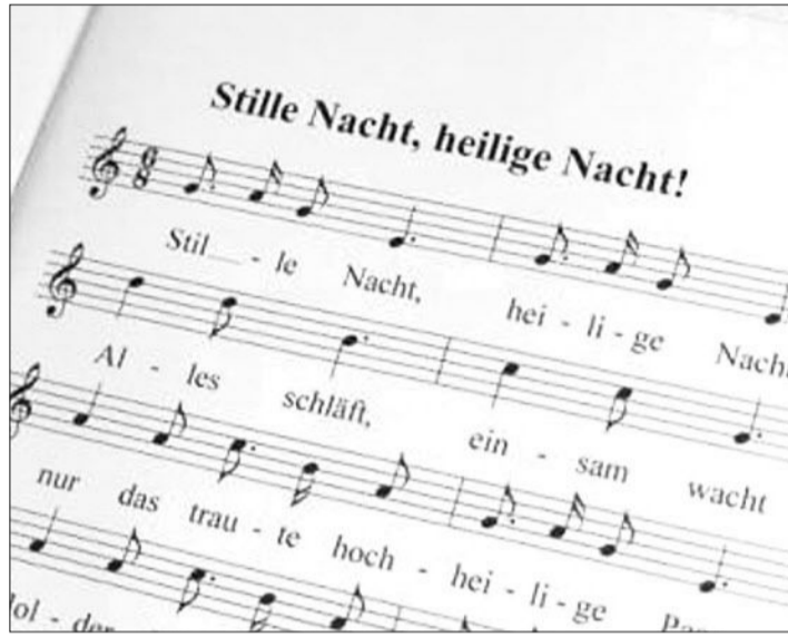
Vom Tiroler Oberndorf in die ganze Welt: Die Geschichte des berühmtesten Weihnachtsliedes in einem Buch.

Da die Orgel in der Oberndorfer Pfarrkirche um die Weihnachtszeit des Jahres 1818 defekt wurde, musste die übliche festliche Musik mit größerer Besetzung entfallen. Der Hilfspriester Josef Mohr hatte darum den mit ihm befreundeten Organisten und Schullehrer Franz Xaver Gruber einen sechsstrophigen Liedtext mit der Bitte übergeben, er möge dazu eine passende Musik für Tenor, Bass, gemischten